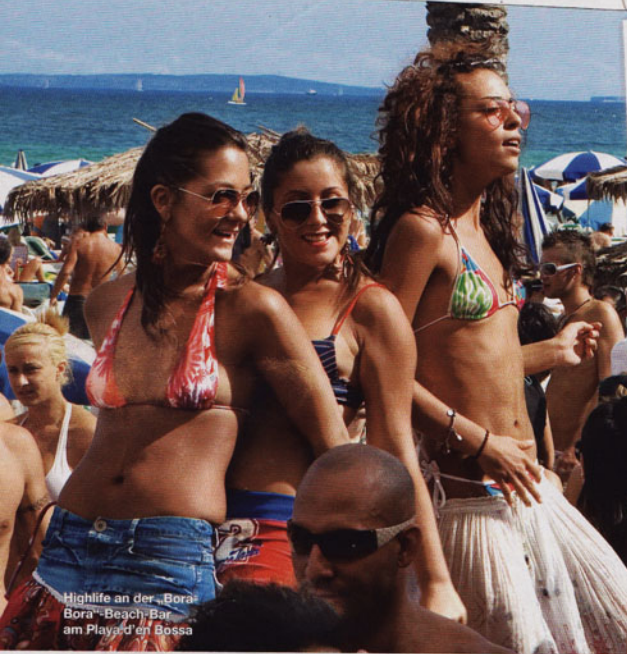
Highlife an der „Bora-Bora“-Beach-Bar am Playa d'en Bossa