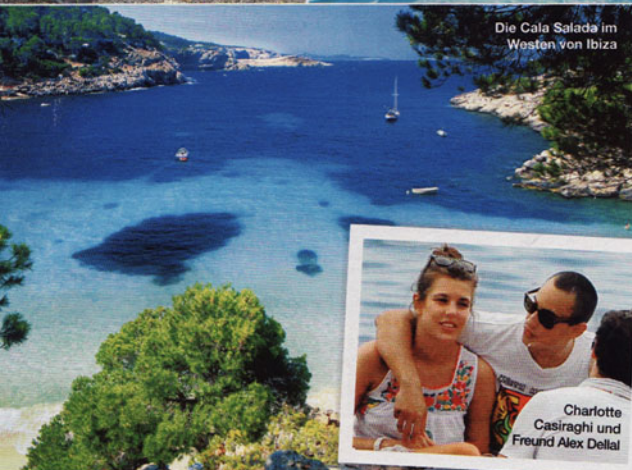
Die Cala Salada im Westen von Ibiza