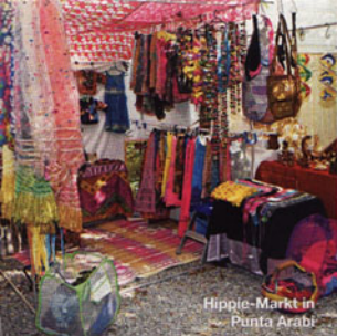
Hippie-Markt in Punta Arabi