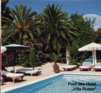
Pool des Hotel „Villa Roses“