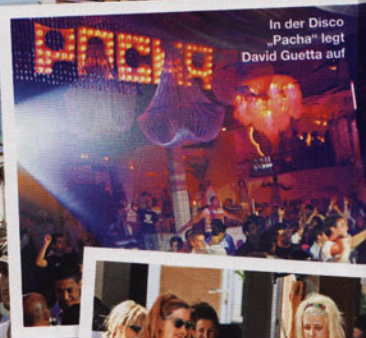
In der Disco „Pacha“ legt David Guetta auf