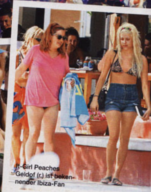
17-Girl Peaches Geldof (r.) ist bekanntester Ibiza-Fan