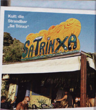
Kult: die Strandbar „Sa Trinxà“